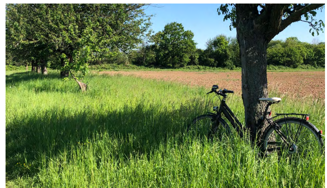
Impressionen aus dem Untersuchungsgebiet

Fokusthema • Mobility Systems, Active Mobility